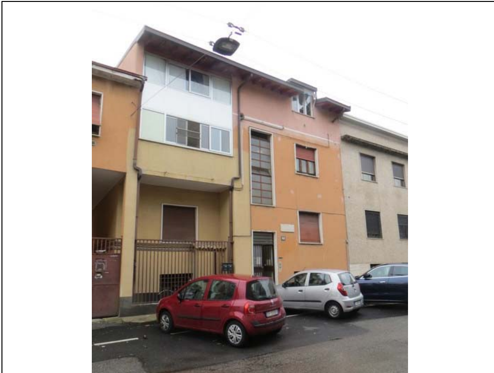
Vista fabbricato da via Michele Pericle Negrotto