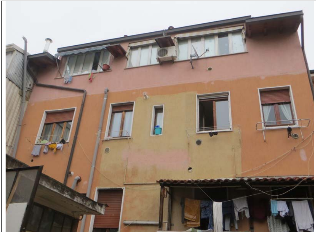
Vista fabbricato dal cortile interno (Lotto 001)