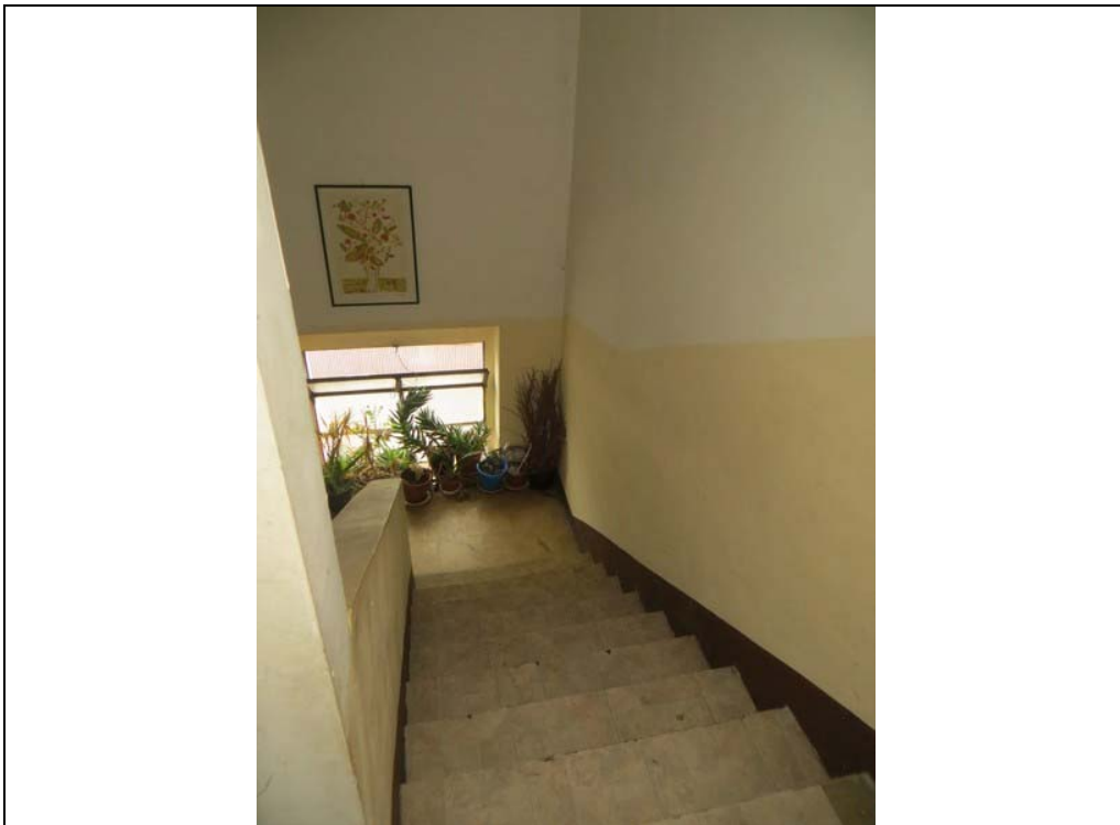
Vista del vano scala comune (Lotto 001)