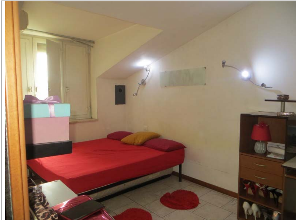
Vista interna dell'appartamento (Lotto 001)