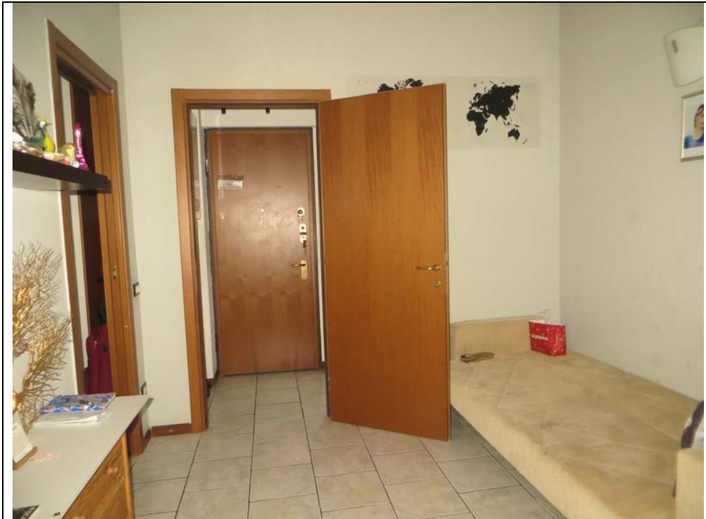
Vista interna dell'appartamento (Lotto 001)