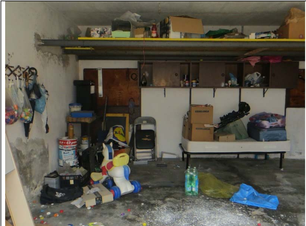
Vista interna del box (Lotto 002)