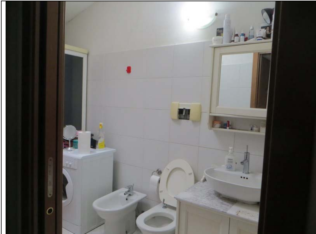
Vista interna dell'appartamento (Lotto 001)