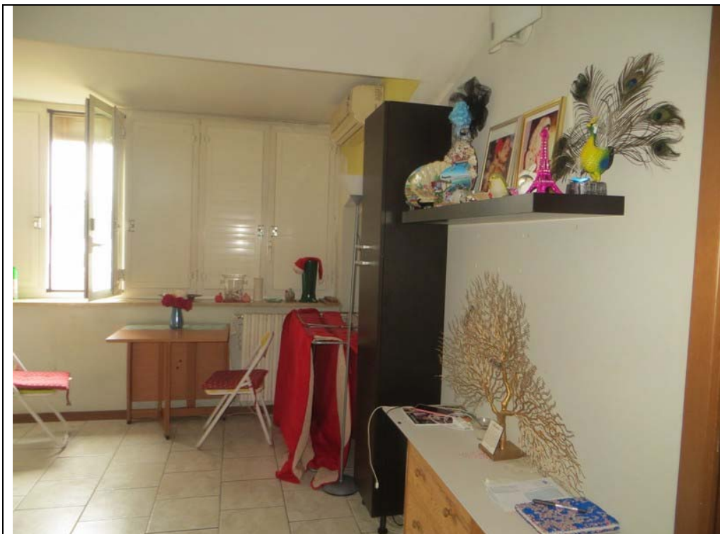
Vista interna dell'appartamento (Lotto 001)