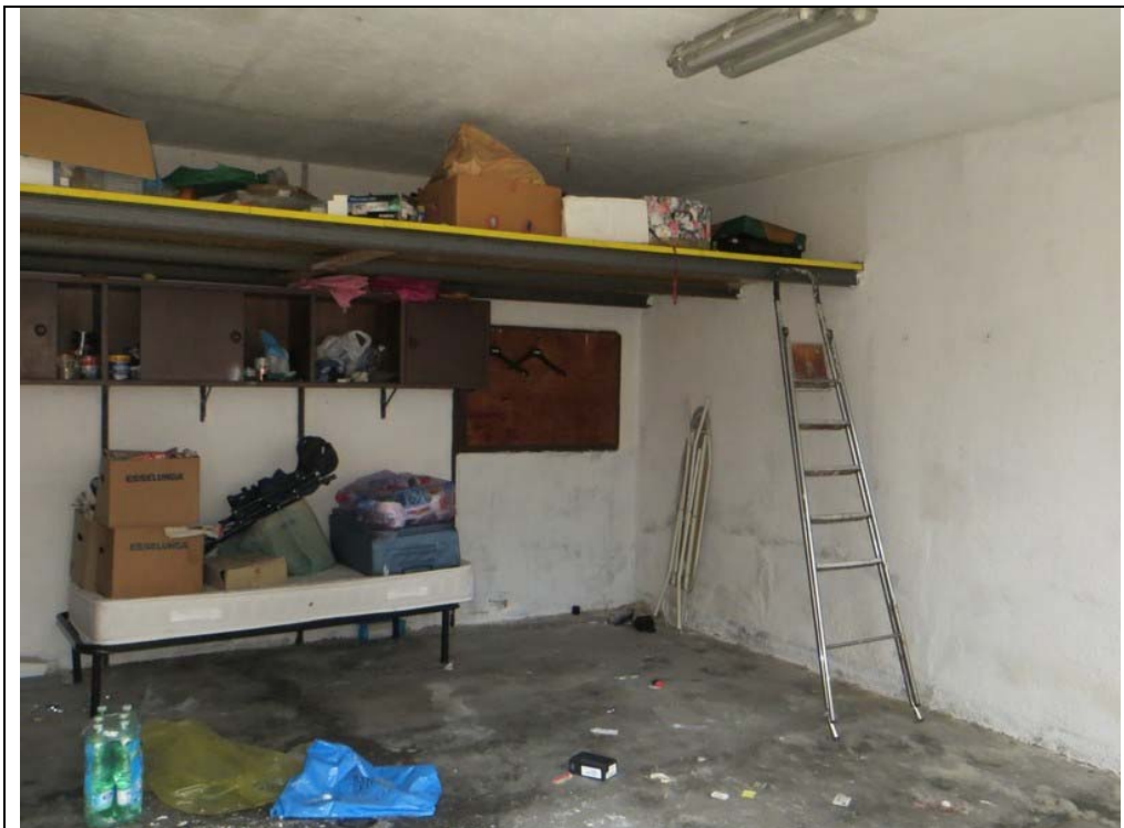
Vista interna del box (Lotto 002)