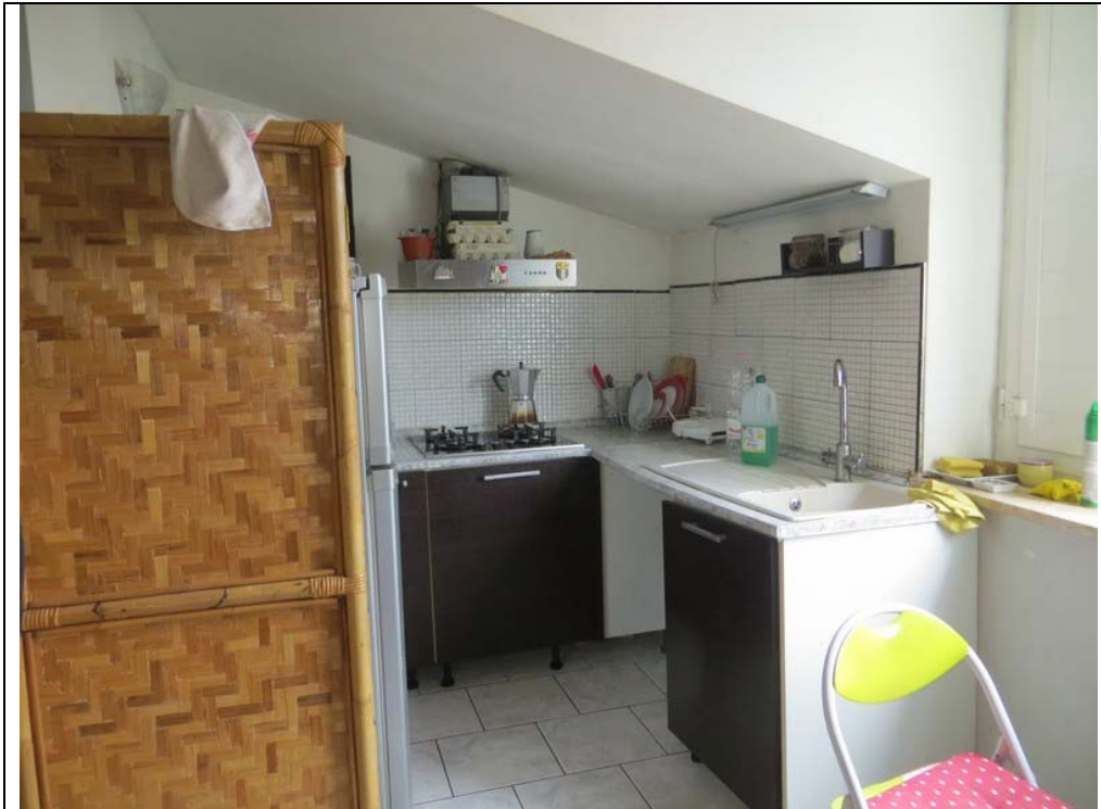
Vista interna dell'appartamento (Lotto 001)