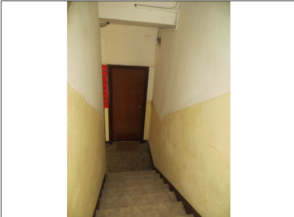
Vista del vano scala comune (Lotto 001)