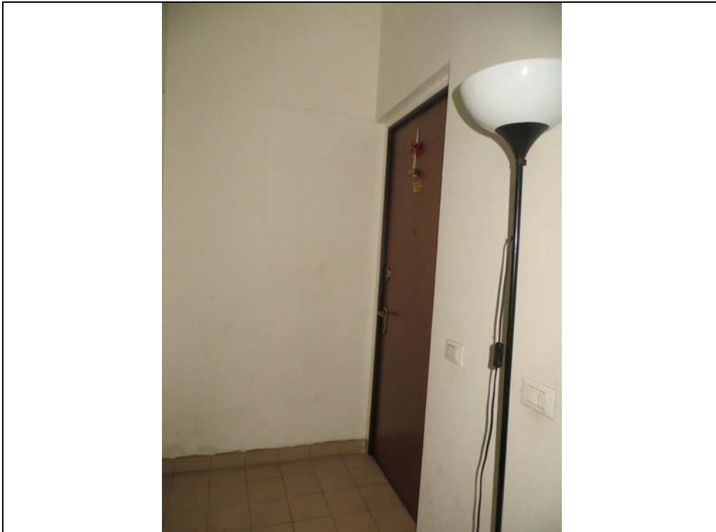
Vista del pianerottolo comune (Lotto 001)