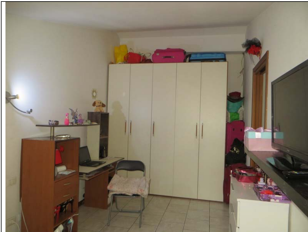
Vista interna dell'appartamento (Lotto 001)