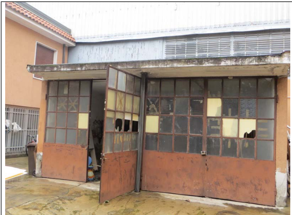
Vista del box nel cortile interno (Lotto 002)