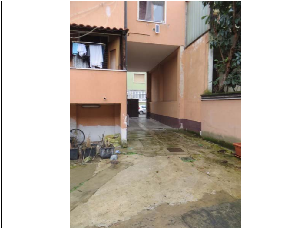
Vista ingresso carraio dal cortile interno