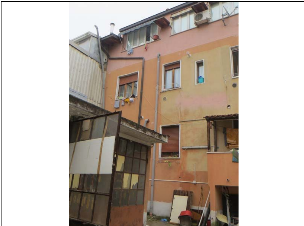
Vista fabbricato dal cortile interno