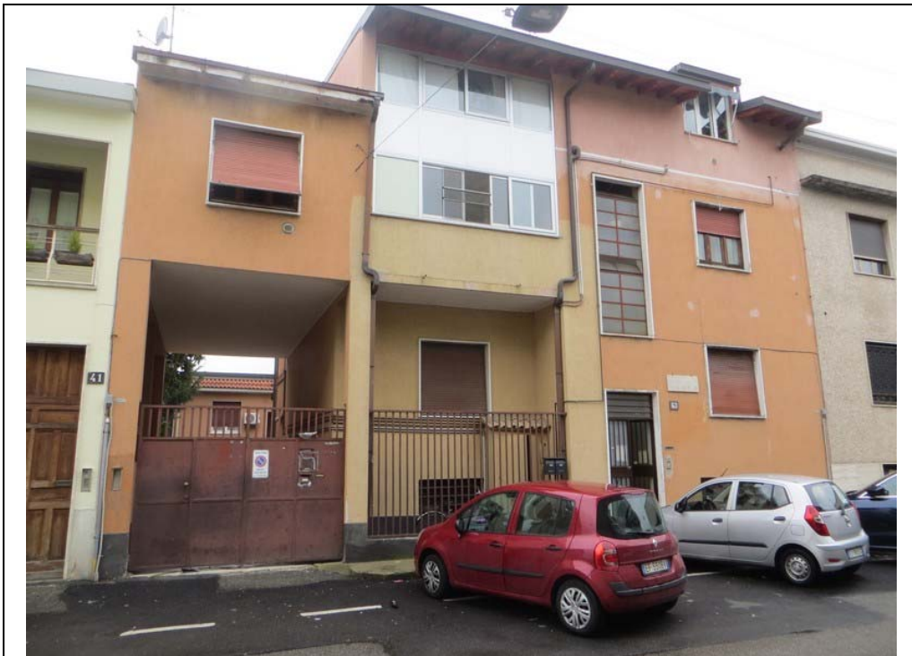
Vista fabbricato da via Michele Pericle Negrotto